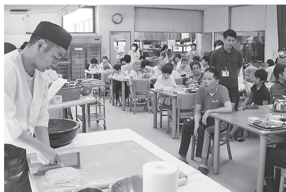
生地を細く切ります♪