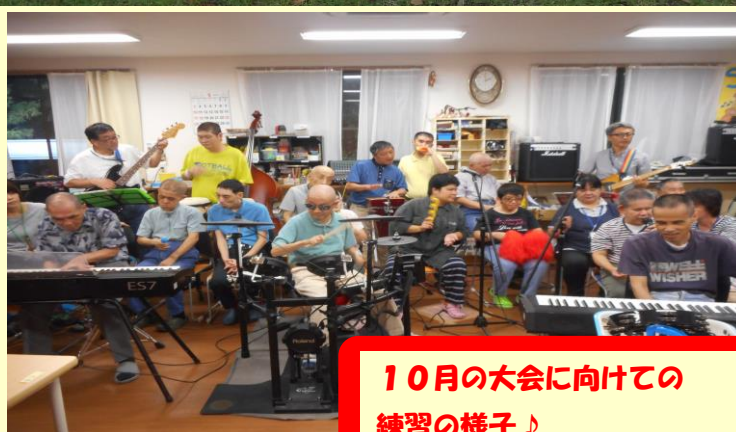
10月の大会に向けての 練習の様子♪