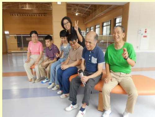
アリーナくにとみでの運動 ドライブと散策の様子