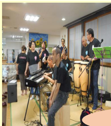
さくら苑でのコンサート♪