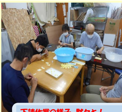
下請作業の様子。黙々と！ 室内レクリエーション♪