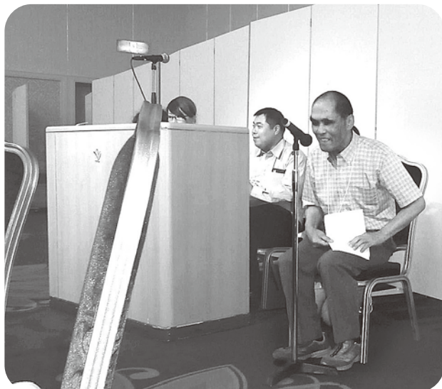
閉会のあいさつを述べる釘松さん