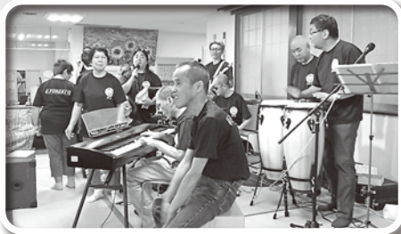
唱歌やオリジナル曲

何かしらの災害等が起こってしまった時に、連携は必須となり、その時に日頃から関係を築いていることのきっかけの一つにもなっていければと思います。