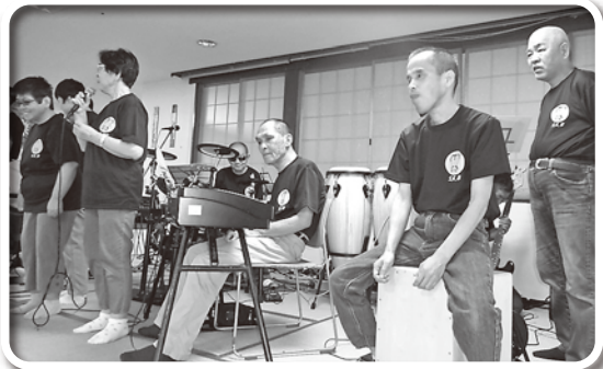
アンコールもいただきました